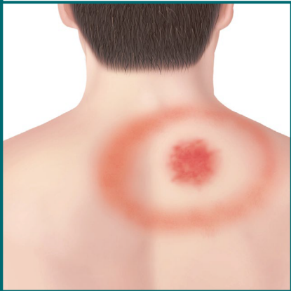
სამიწის ტიპის დაზიანება