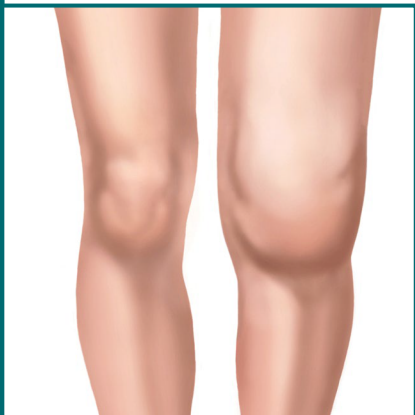
მუხლის სახსრების ართრიტი